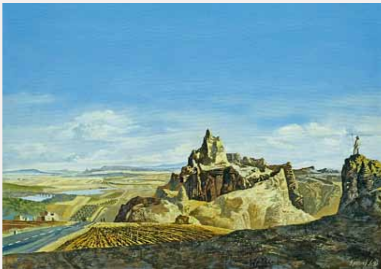
ДОРОГА К РАТАНУ — 600. 1996. ХОЛСТ, МАСЛО