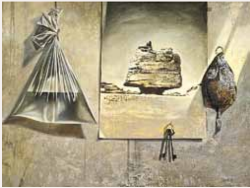
ТРЕВОЖНЫЙ СОН РЫБЫ. 1987. ХОЛСТ, МАСЛО

в них доминантной. В этих произведениях Краснов не только предупреждал о нависшей над человечеством опасностью — он бескомпромиссно выражал свою активную гражданскую позицию, смело говорил о необходимости сохранения природы, общечеловеческих ценностей, авторски трактовал роль личности в истории. Эти произведения и эти темы современные и сегодня, достаточно посмотреть, с каким интересом смотрят посетители выставки и особенно молодёжь триптих «Азбука геноцида», названный в своё время критикой произведением, посвящённым теме «расцвета и распада глобальной утопии “общества всеобщего благоденствия”».