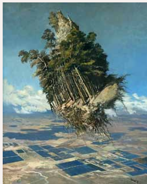
ОДА ВЗЛЕТЕВШЕМУ ОСТРОВУ. 1985. ХОЛСТ, МАСЛО