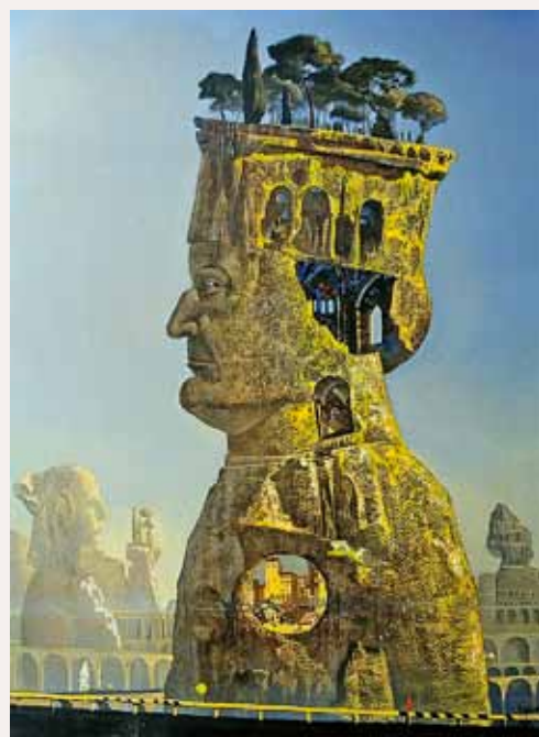
ФИЛОСОФ. 2018. ХОЛСТ, МАСЛО