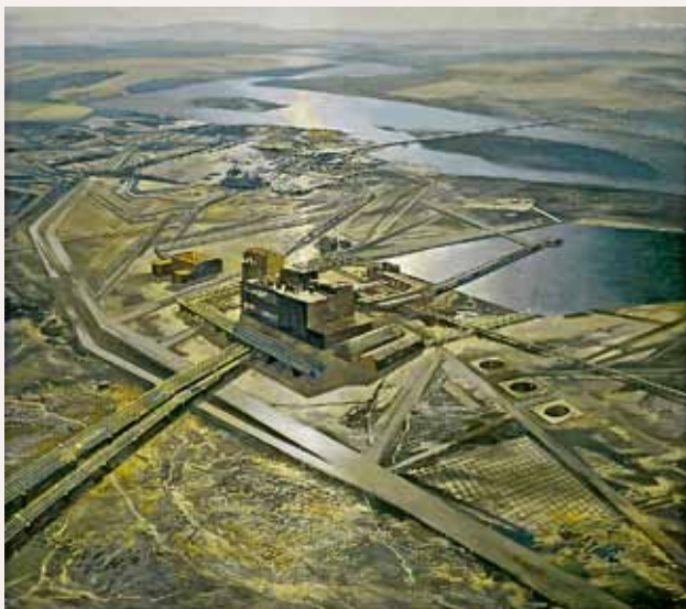
ПОСЛЕ ТРУДОВОЙ НЕДЕЛИ. 1984. ХОЛСТ, МАСЛО