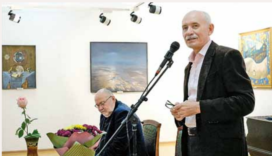
ПОЗДРАВЛЕНИЕ ГЛАВЫ РЕСПУБЛИКИ БАШКОРТОСТАН Р.З. ХАМИТОВА